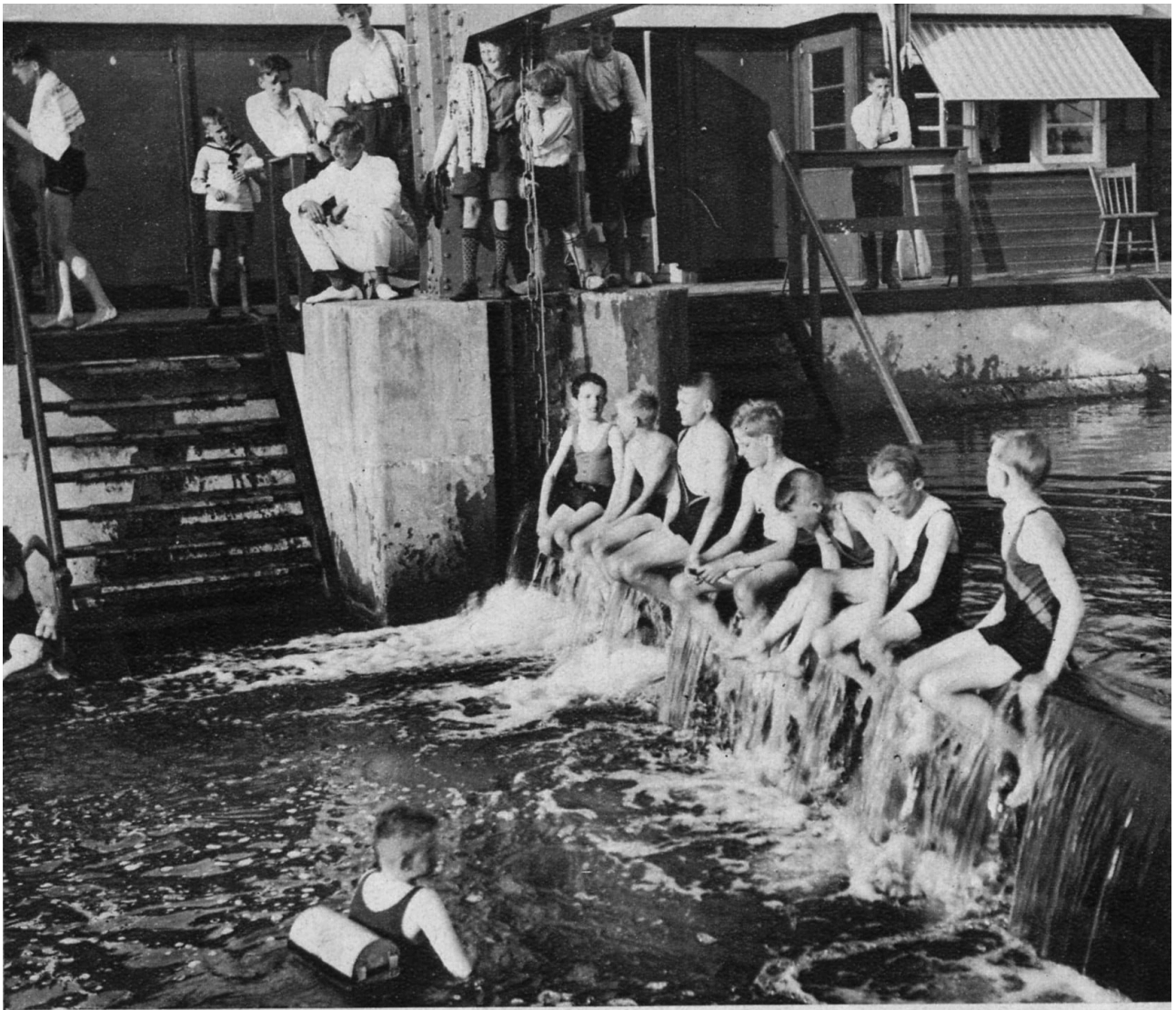
Watervreugde in 't gemeentelijk zwembad van Varsseveld.